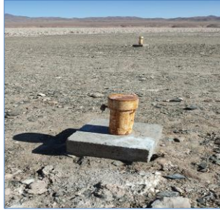
Fotografía punto monitoreo