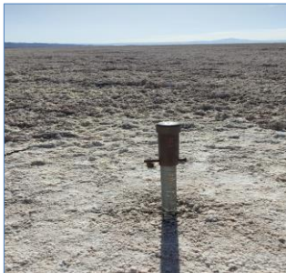
Fotografía punto monitoreo