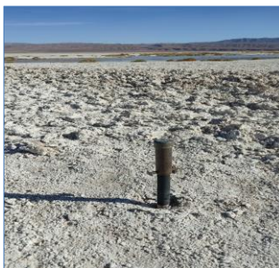
Fotografía punto monitoreo