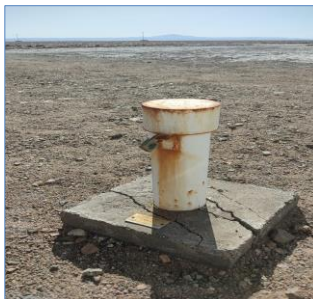
Fotografía punto monitoreo