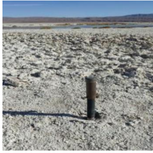
Fotografía punto monitoreo