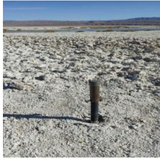
Fotografía punto monitoreo