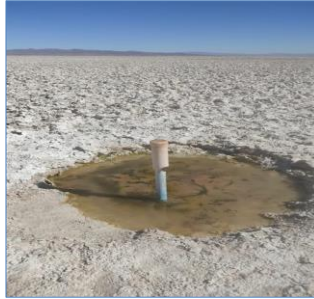
Fotografía punto monitoreo