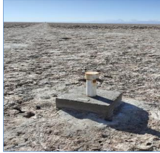
Fotografía punto monitoreo