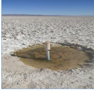
Fotografía punto monitoreo