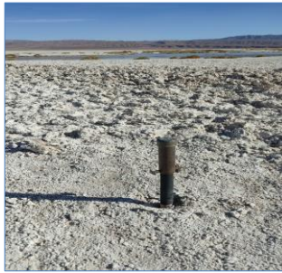
Fotografía punto monitoreo