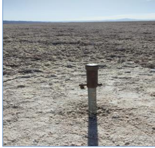
Fotografía punto monitoreo