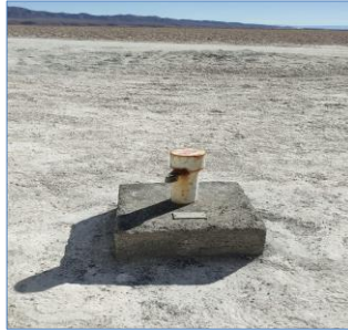
Fotografía punto monitoreo