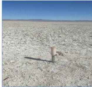
Fotografía punto monitoreo