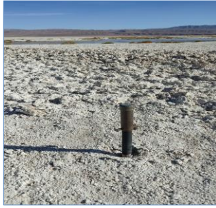
Fotografía punto monitoreo