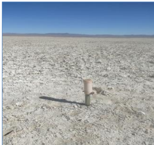
Fotografía punto monitoreo