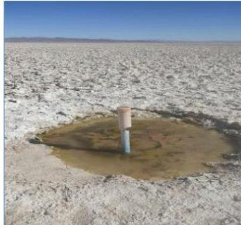
Fotografía punto monitoreo