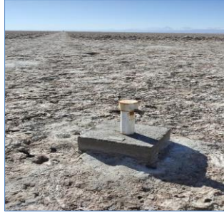
Fotografía punto monitoreo