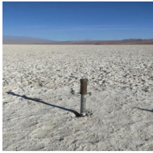
Fotografía punto monitoreo