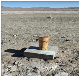
Fotografía punto monitoreo