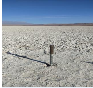
Fotografía punto monitoreo