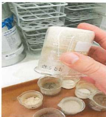
Imágenes sin realización de análisis para Granulometría

Sin otro particular, se despide. Atentamente..